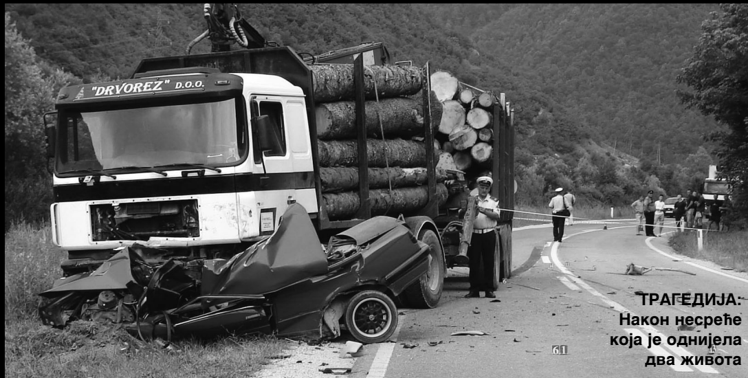
ТРАГЕДИЈА: Након несреће која је однијела два живота

На подручју које покрива Станица јавне безбједности и Полицијска станица за безбједност саобраћаја Мркоњић Град до краја августа мјесеца се догодило 66 саобраћајних несрећа , што је за 2,94 одсто мање него у истом периоду прошле године. У саобраћајним несрећама две особе су изгубиле живот , док је три тешко и 11 лакше повријеђено .