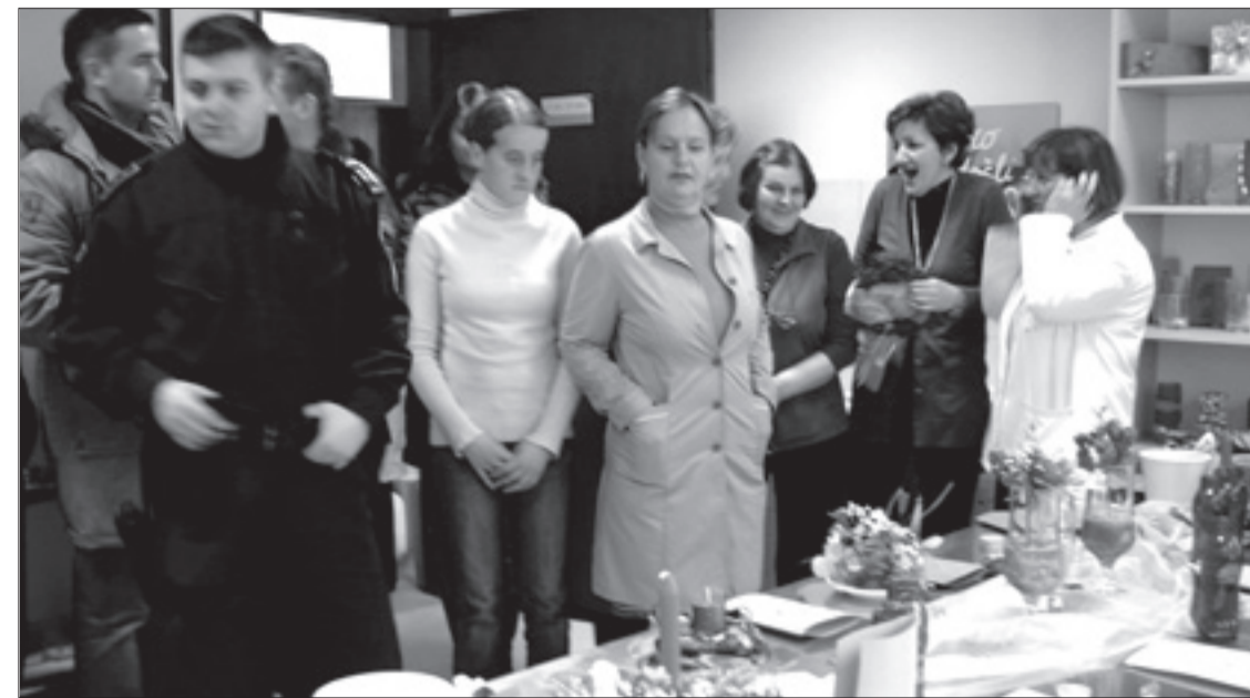
Детаљ са отварања

У мркоњићком Дому здравља „Др Јован Рашковић“ у сриједу је озваничен рад Центра за ментално здравље. У уређење и опремање простора за рад центра италијанска невладина организација „Чезви“ уложила је 75 хиљада марака.