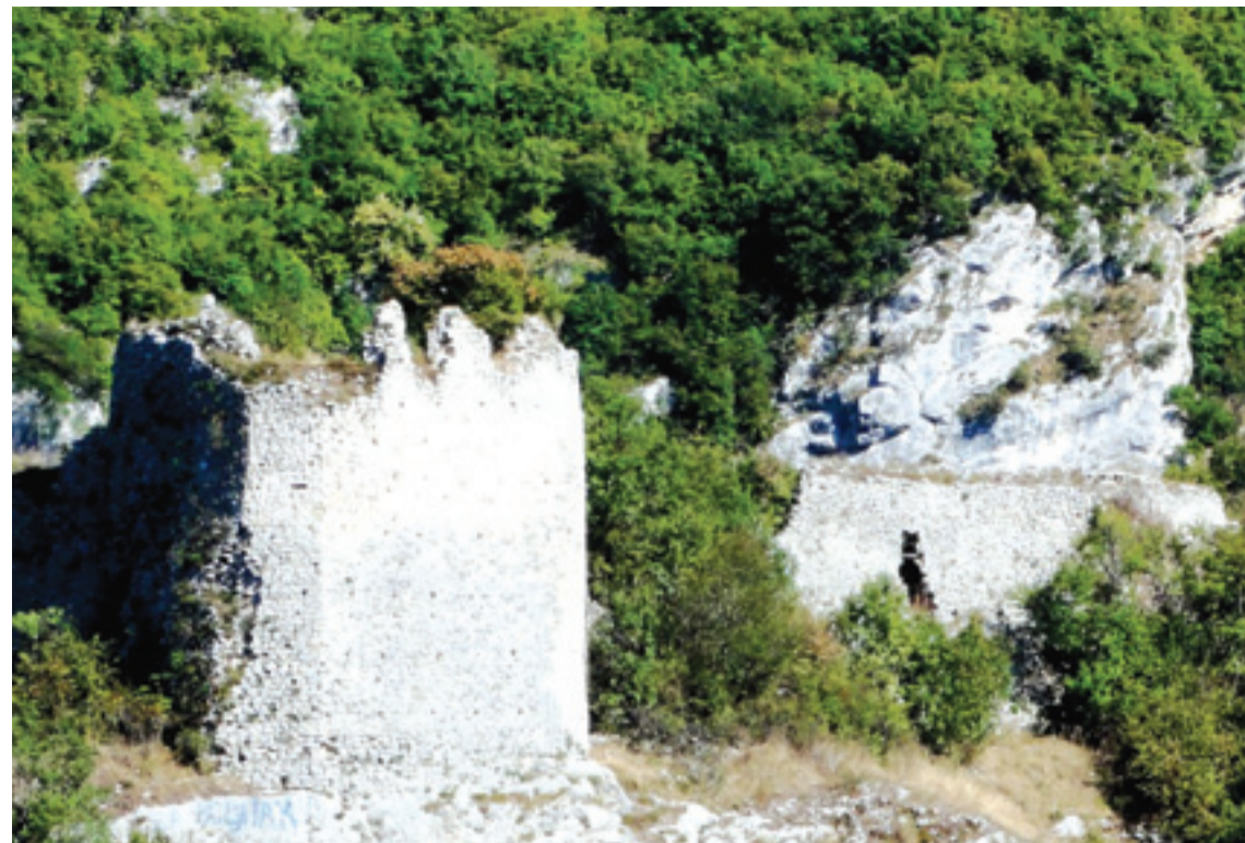
Стари град Бочац

ДОМ ЗДРАВЉА „ДР ЈОВАН РАШКОВИЋ“ У МРКОЊИЋ ГРАДУ