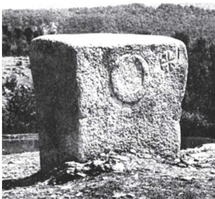
Стећак у Баљвинама