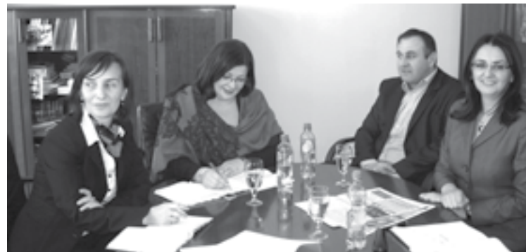
Разговор са руководством општине

Улагање у школство на подручју општине Мркоњић Град