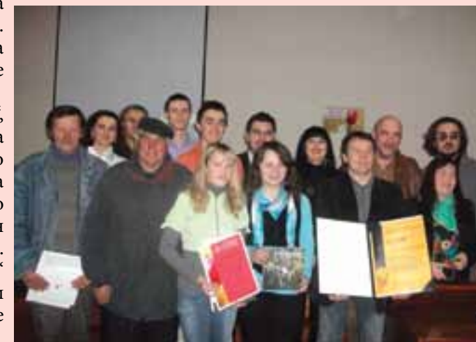
Учесници пјесничке вечери