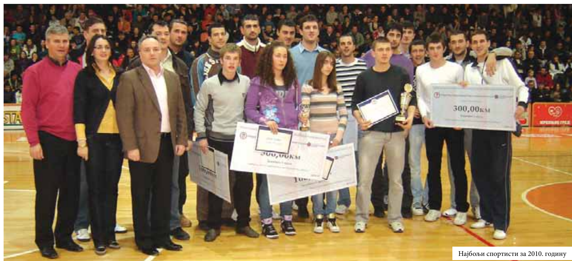
Најбољи спортисти за 2010. годину

Организатор и покровитељ манифестације била је општина Мркоњић Град, уз техничку помоћ ЈУ "МГ спорт". Завршна манифестација одржана је у дворани "Арена Комерцијалне банке" пред 1.200 гледалаца.