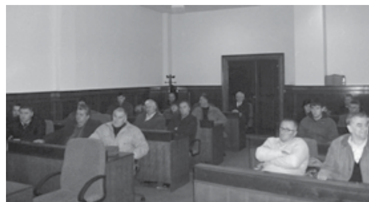
Годишња скупштина Удружења

Субвенције за пчеларе, те висина чланарине главне су теме о којима се говорило на 7. Годишњој скупштини Удружења пчелара „Матичњак“, која је одржана 26. фебруара. Чланови скупштине одлучили су да висина чланарине остане на прошлогодњем нивоу (30 КМ), а да од субвенције на коју пчелари имају право у овој години, 10% издвоје за рад Удружења. На састанку је било ријечи и о резултатима рада и финансијском пословању у прошлој години, а усвојен је и План рада за 2011. годину. Удружење пчелара „Матичњак“ сачинило је списак својих чланова који