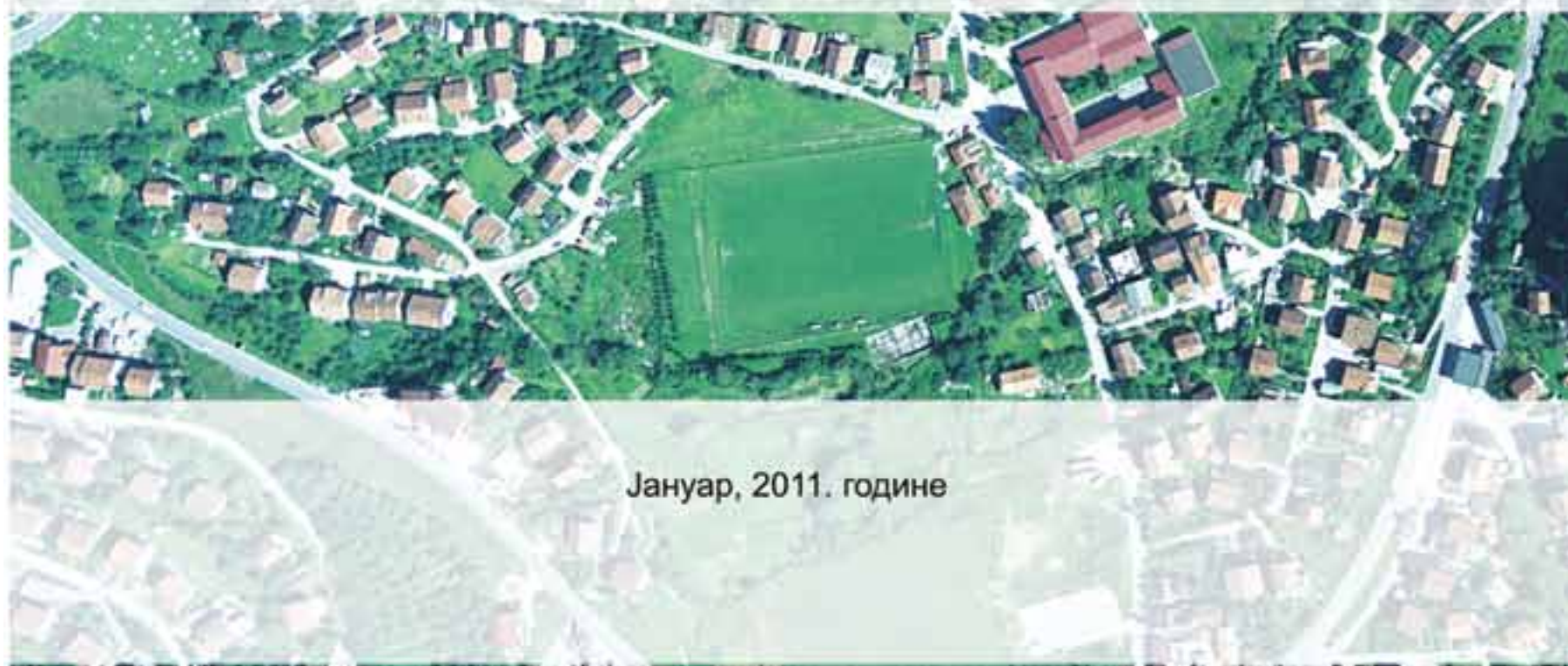
Јануар, 2011. године

За све детаљније информације обратите се запосленим у Одјељењу за просторно планирање и комуналне послове Административне службе Општине Мркоњић Град (канцеларија број 26. Шалтер сала, шалтер бр. 3.)