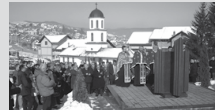
Спомен - обиљежје масовне гробнице