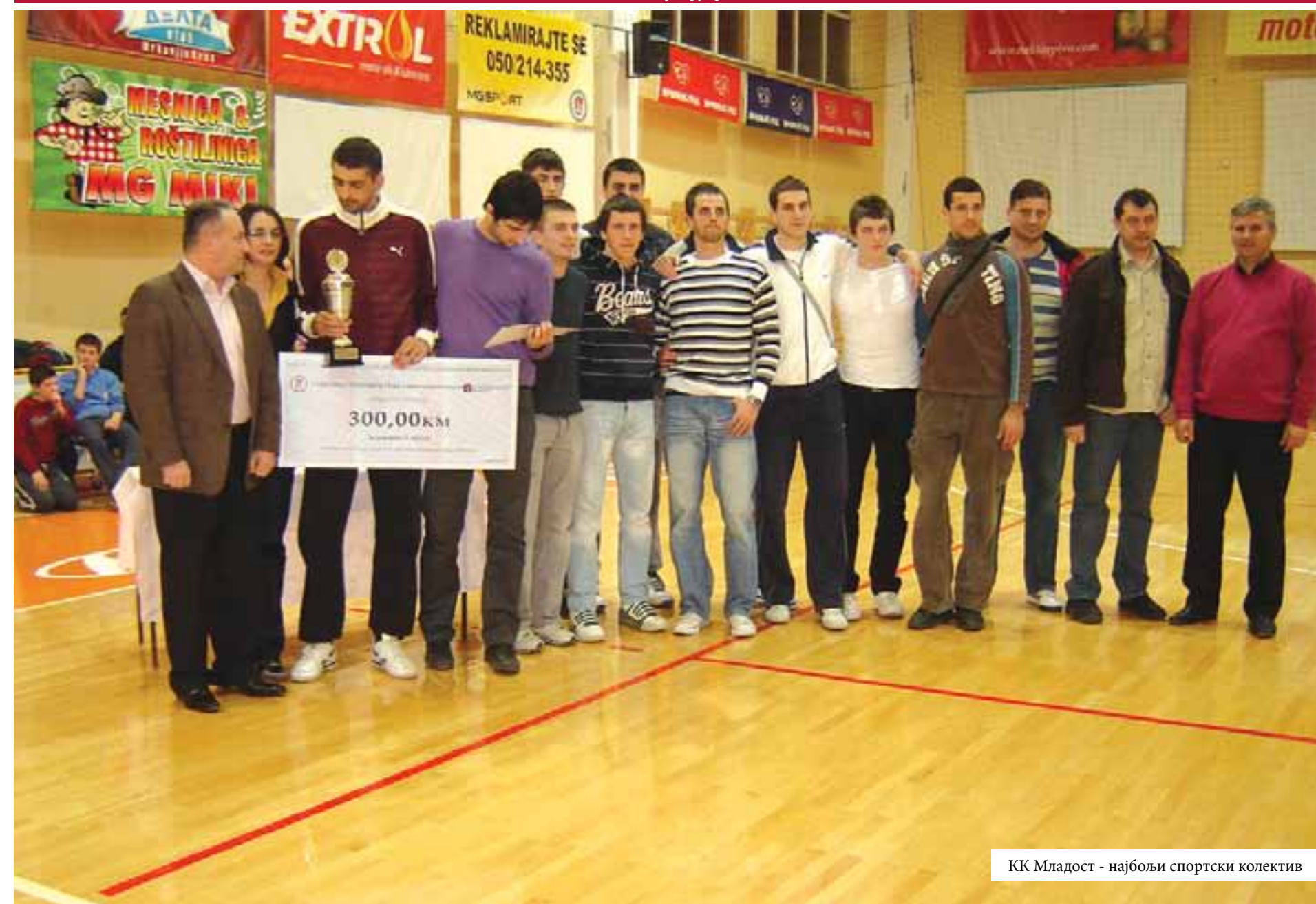
КК Младост - најбољи спортски колектив