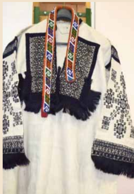
Женска хаљина из Ораховљана