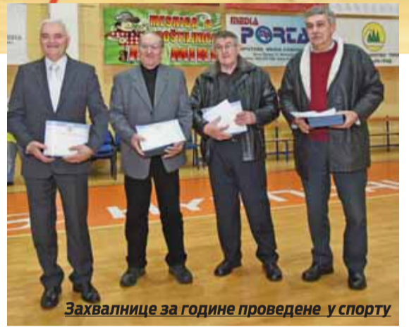
Захвалнице за године проведене у спорту