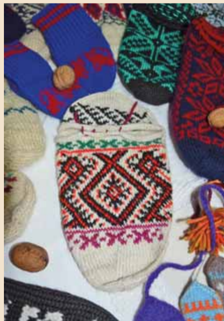
Најљепши узорак приглавка Клуба српских сестара из Мркоњић Града