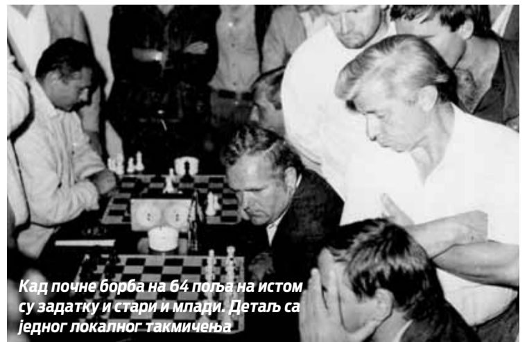
Кад почне борба на 64 поља на истом су задатку и стари и млади. Детаљ са једног локалног такмичења