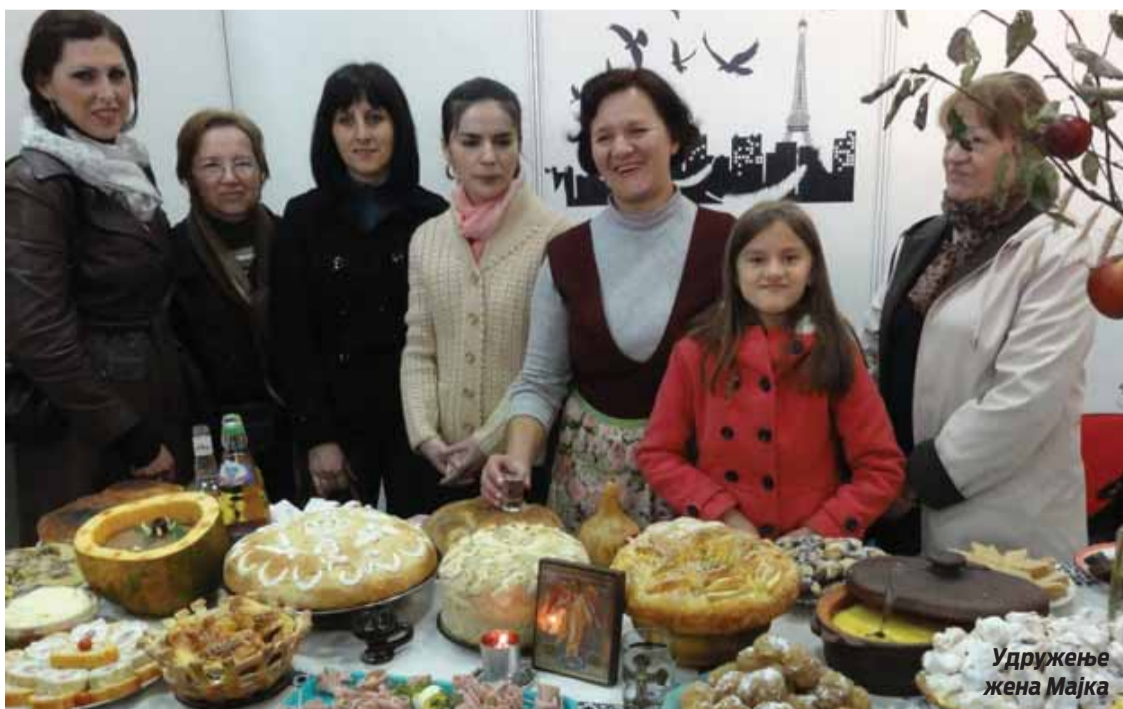
Удружење жена Мајка