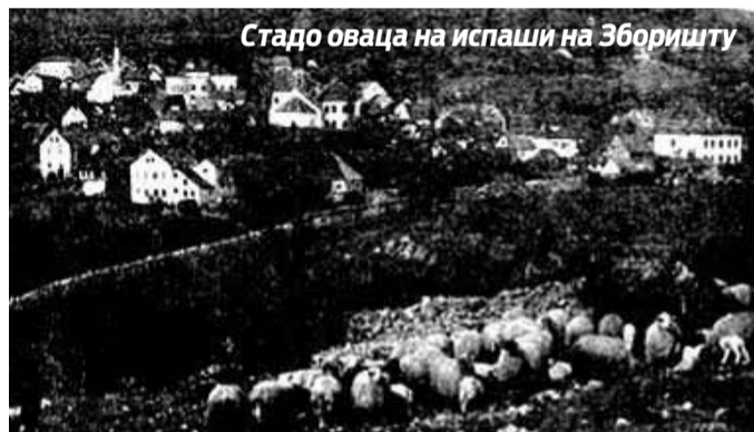
Стадо оваца на испашу на Зборишту