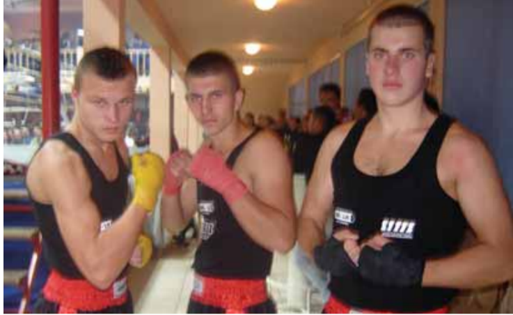
чењима. Млади боксери су показали завидан таленат и жељу за

– Ријеч је углавном о младим и перспективним такмичарима, међу којима је било и неколико боксера државних првака и са освојеним медаљама на великим такми-