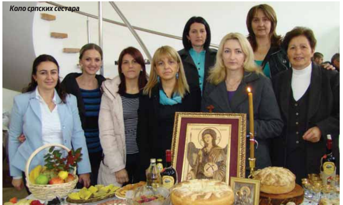
Коло српских сестара