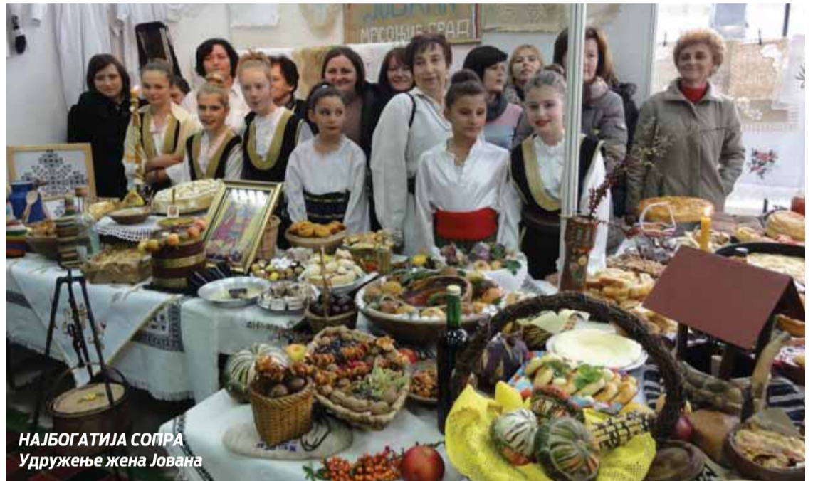
НАЈБОГАТИЈА СОПРА Удружење жена Јована