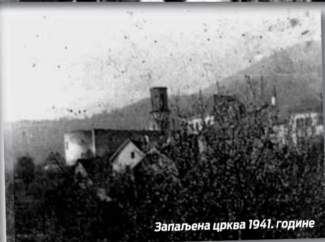
Запаљена црква 1941. године

су били учесници у овим радњама, од општинских власти били су кажњени са по три мјесеца затвора. Ову причу ми је испричао један од учесника овог светог чина, који је за награду доспио у затвор.