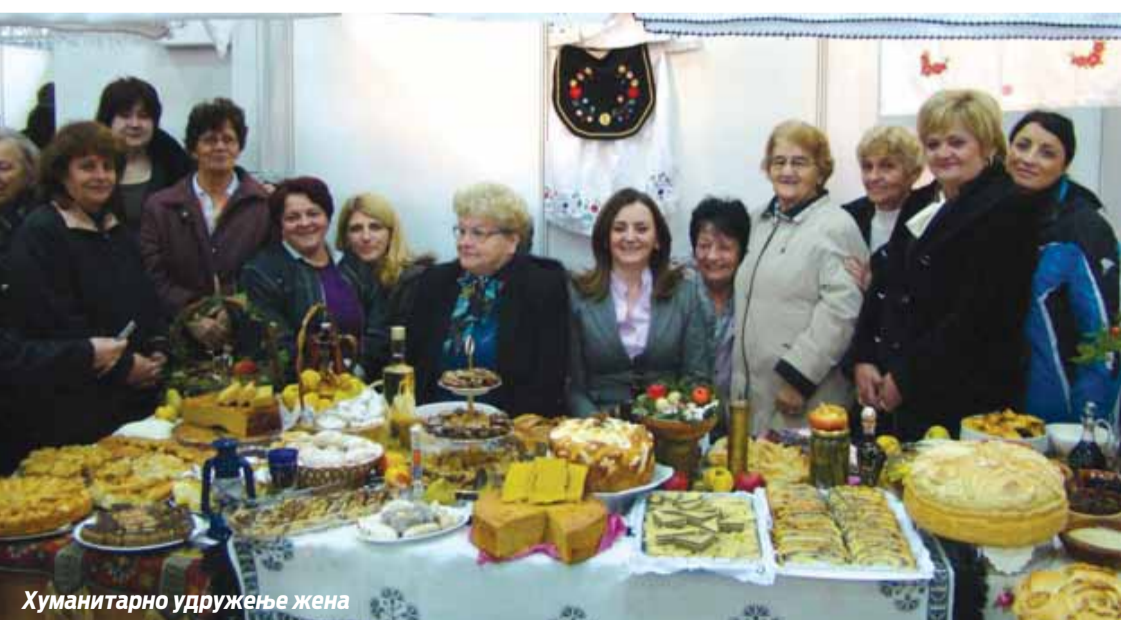
Хуманитарно удружење жена