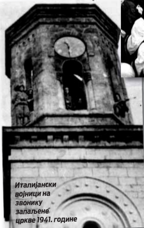
Италијански војници на звонику запаљене цркве 1941. године