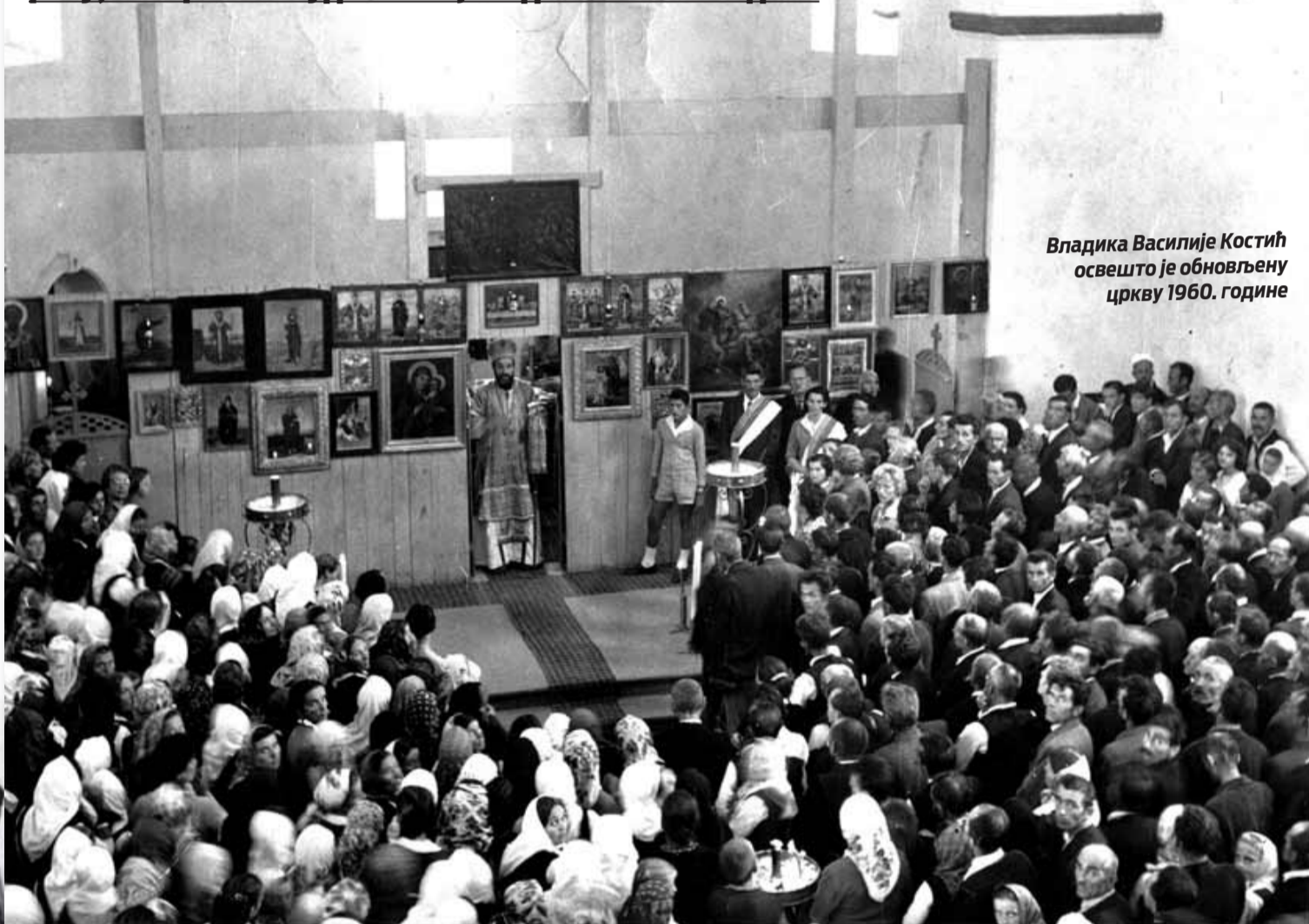
Владика Василије Костић освешто је обновљену цркву 1960. године