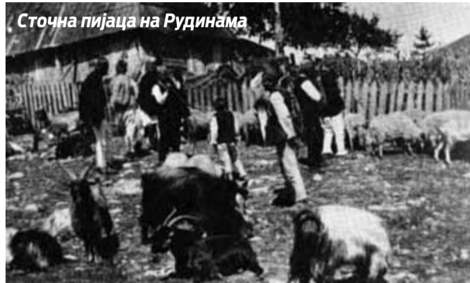
Сточна пијаца на Рудинама