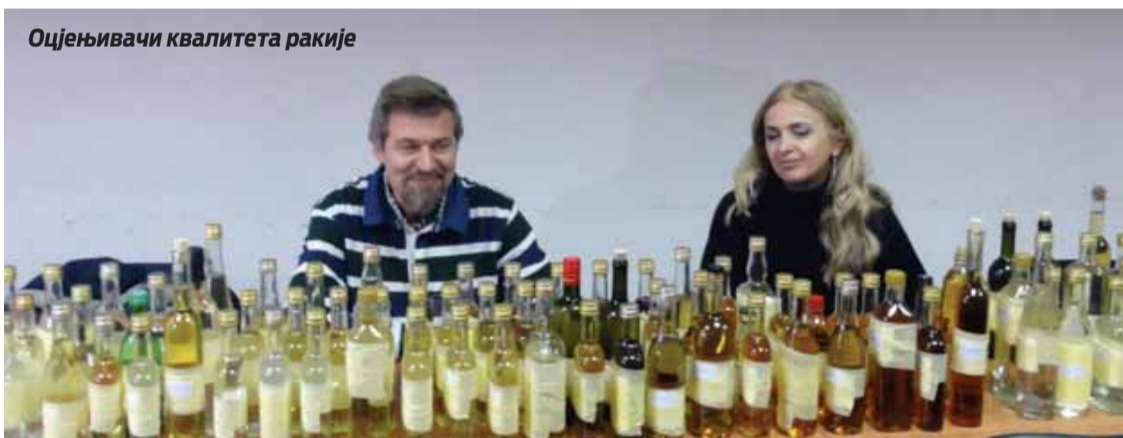
Оцјењивачи квалитета ракије