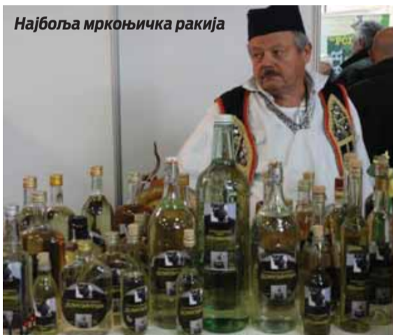
Најбоља мркоњићка ракија