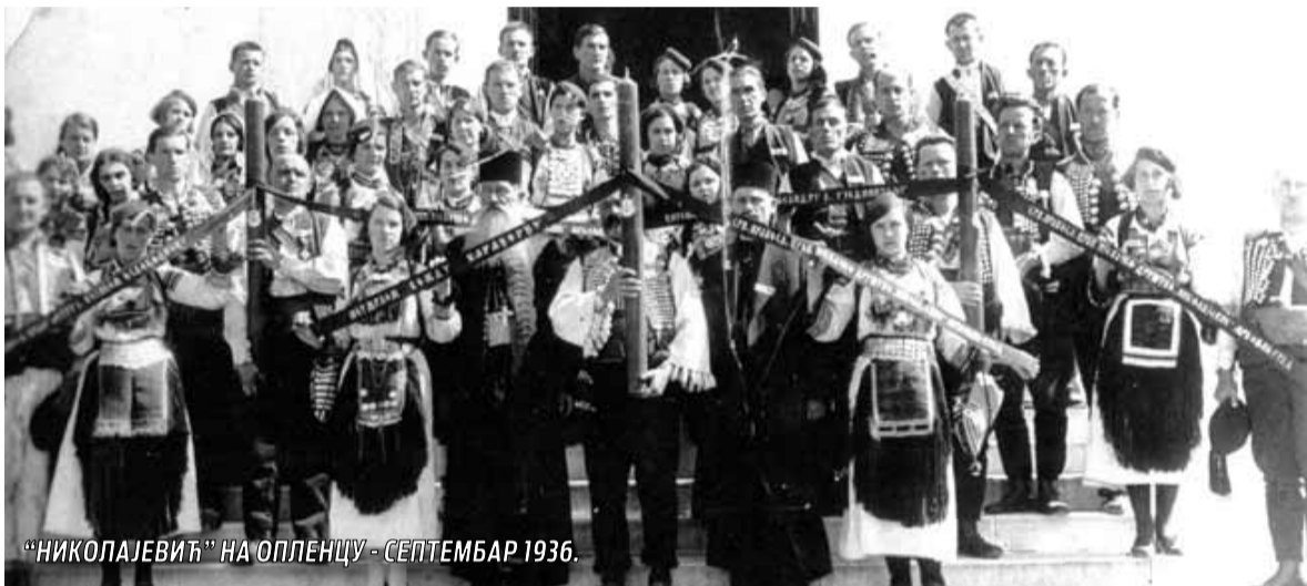
„НИКОЛАЈЕВИЋ“ НА ОПЛЕНЦУ - СЕПТЕМБАР 1936.