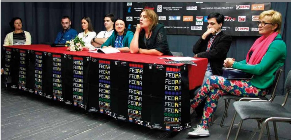
ФЕМА НА ФЕДРИ: Градско позориште Мркоњић Град је успјешно извело представу „Свако време има своје Феме“ на 41. Театарском фестивалу Босне и Херцеговине ФЕДРА 2013 у Бугојну. Глумци овог позоришта су након представе учествовали на округлом столу и одговарали на бројна питања присутних.