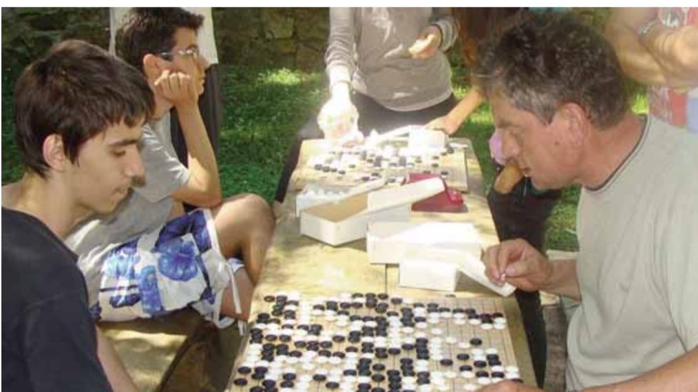
ТУРНИР У ГО-У НА ЗЕЛЕНКОВЦУ: На излетишту Зеленковац код Мркоњић Града одржан је Међународни турнир у ГО-у, древној далекоисточној игри која је полако освојила и Европу. Ријеч је о једној мисаоној игри гдје су најједноставнија правила а игра је најкопликованија. Ове године је било 24 такмичара из Словеније, Хрватске, Србије и Босне и Херцеговине, међу којима је било и осморо дјеце.