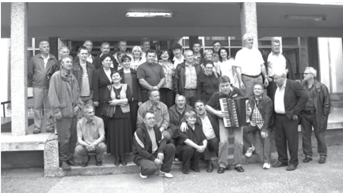
дружење професора из М. Града, Шипова и Брода