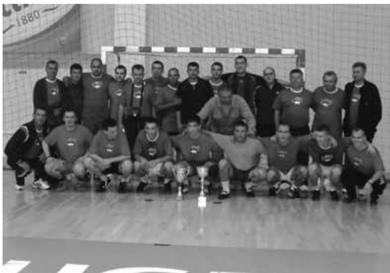
Побједничка екипа „Медна Матица“