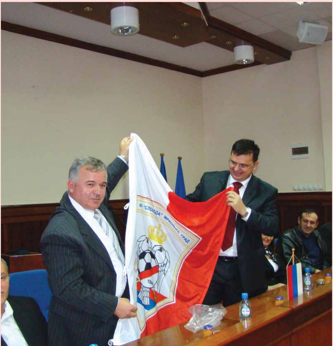
Спремно дочекати старт у првој лиги

ПРОСЛАВА -Освајање шампионске титуле у Другој лиги фудбалери, руководство клуба и навијачи прославиће 4. јула на стадиону „Луке“. Тога дана биће одиграна ревијална утакмица, а потом ће услједити дружење уз пиво, печеног вола и мизику.