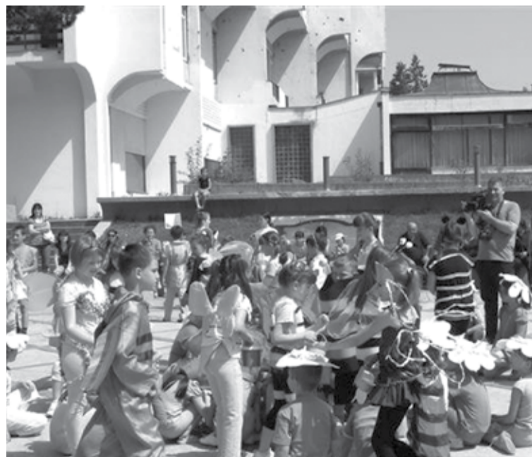
деталј са маскенбала

жељели да покажемо како се ми дружимо и чувамо нашу планету, како би то чинили и старији“, рекла је Глигорићева. С.Дакић