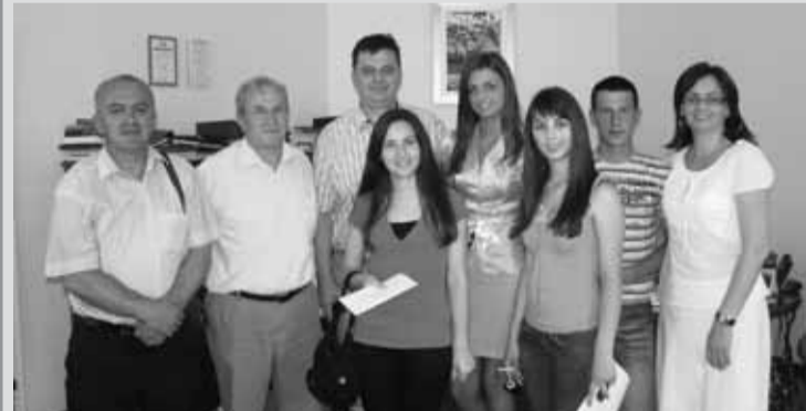
Ученици средњих школа на пријему код начелника

На пријему код начелника општине присуствовало је 12 ученика основних школа „Петар Кочић“, „Иван Горан Ковачић“, „Вук Караџић“ и „Бранко Ђопић“, као и четири ученика „Гимназије“ и „Машинске школе“. Они су били ученици генерације и „вуковци“ и они су остварили одличне резултате на републичким и регионалним такмичењима.