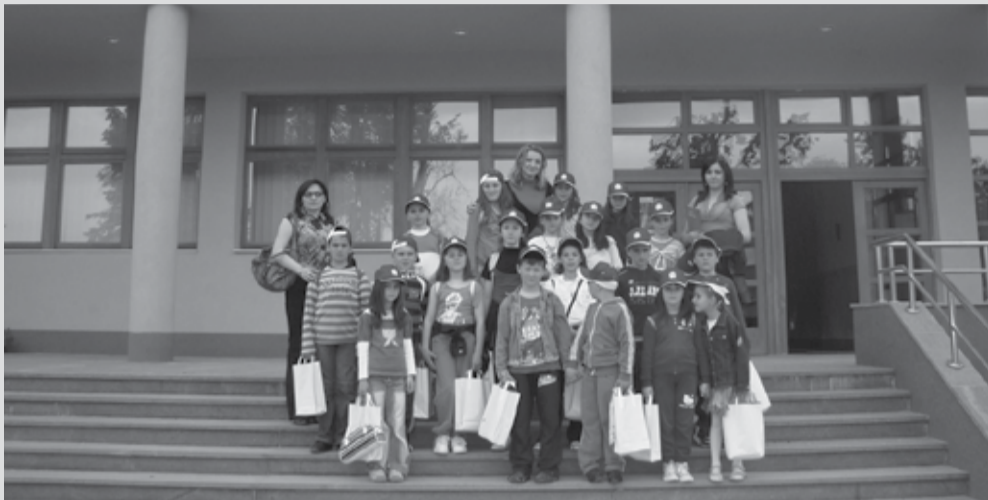
Ученици из Ораховљана у посјети граду