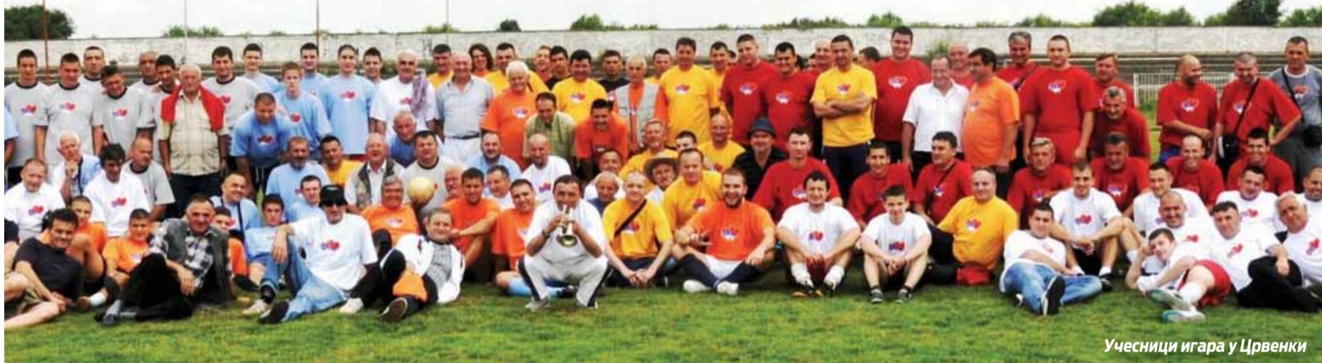
Учесници игара у Црвенки