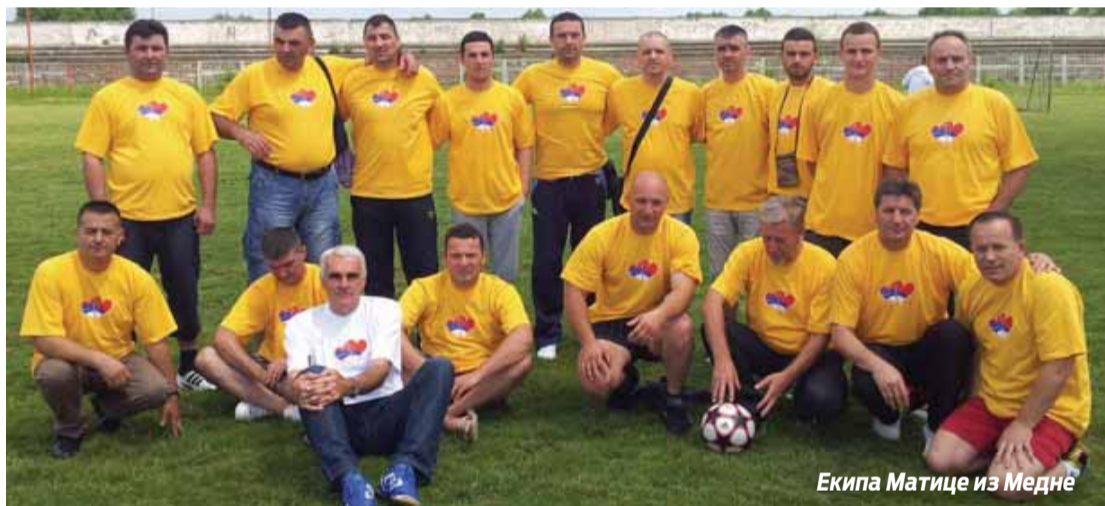
Екипа Матице из Медне

- Са циљем да се окупљамо и дружимо без обзира гдје живимо, 2002. године основали смо Удружење Медљанаца у Новом Саду, а ја сам од ове године предсједник удружења. Подржавамо све активности везане за наше сусрете, за изградњу инфраструктуре у на-