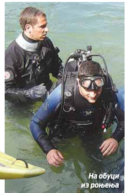
На обуци из роњења