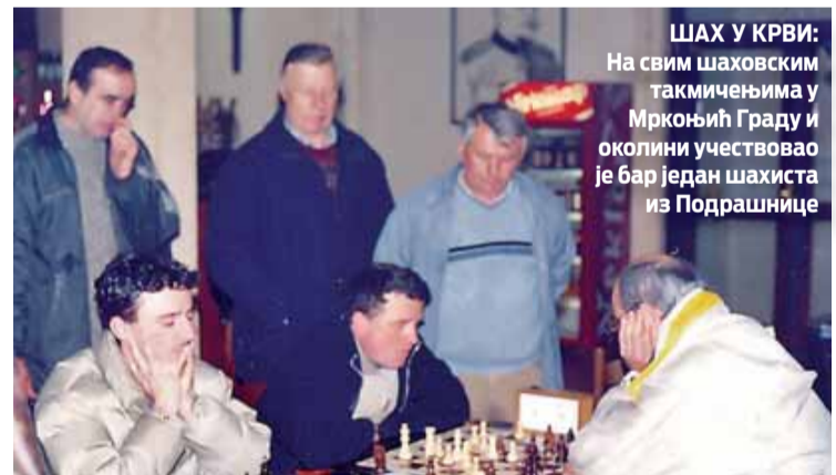
ШАХ У КРВИ: На свим шаховским такмичењима у Мркоњић Граду и околини учествовао је бар један шахиста из Подрашнице

У временском периоду 1980. до 1991. године у више наврата и са