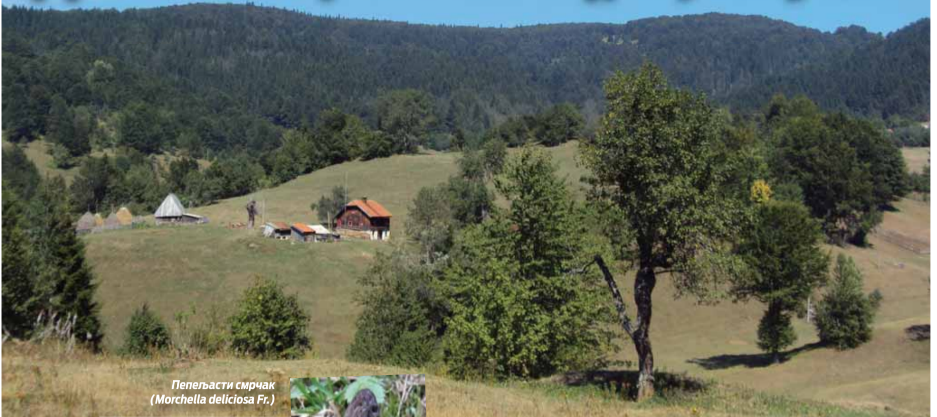
Пепењаста смрчак ( Morchella deliciosa Fr. )