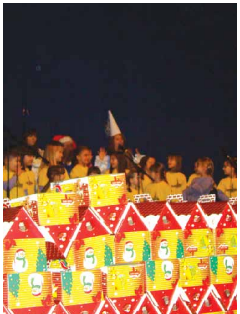
Представа приликом додјеле пакетића

Хуманитарна акција "Пакетић за љепши осмијех", током које су волонтери посетили 60 малишана општине Мркоњић Град окончана је крајем јануара.