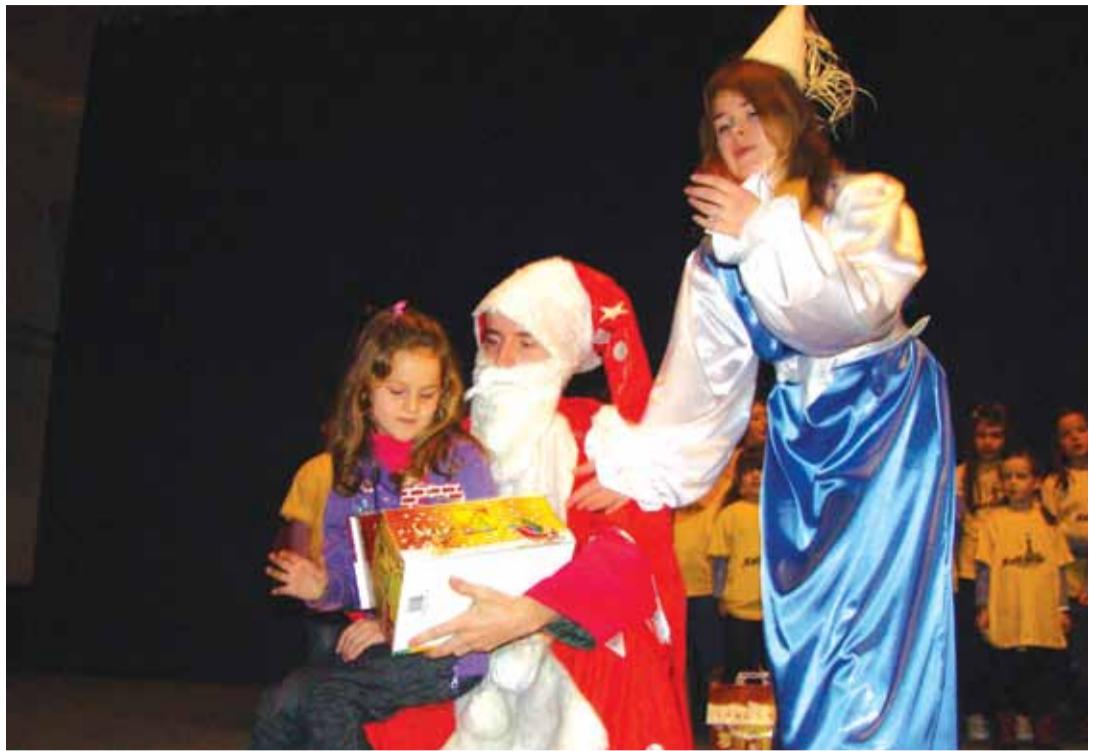
Дједа Мраз и Вила уручују пакетић