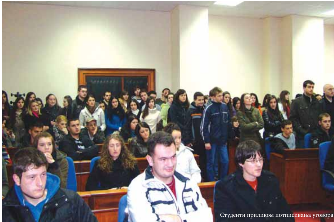
Студенти приликом потписивања уговора

Општина Мркоњић Град је према истраживању Центра цивилних иницијатива, ко-