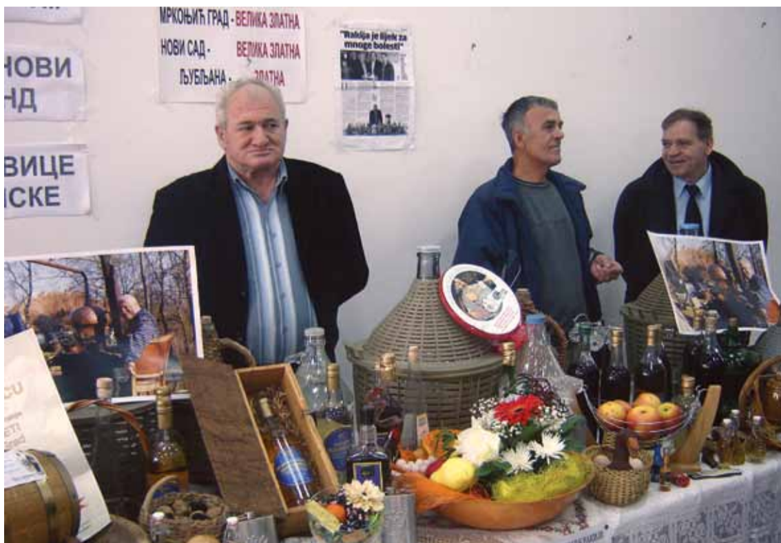
Лакета побједник на фестивалу ракије

Фестивал је осим изложбеног имао и савјетодавно-едукативни карактер, па је за пољопривреднике одржано више стручних предавања.