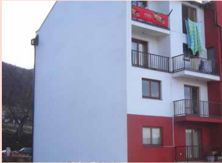
Зграда у Подоруглу