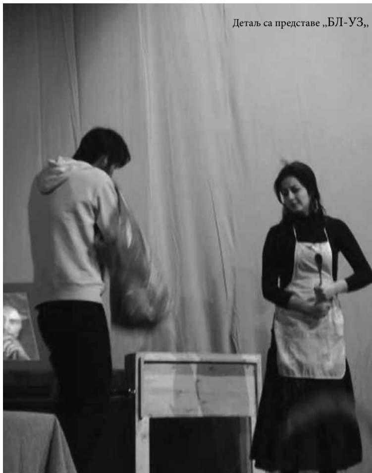
Детаљ са представе „БЛ-УЗ“.