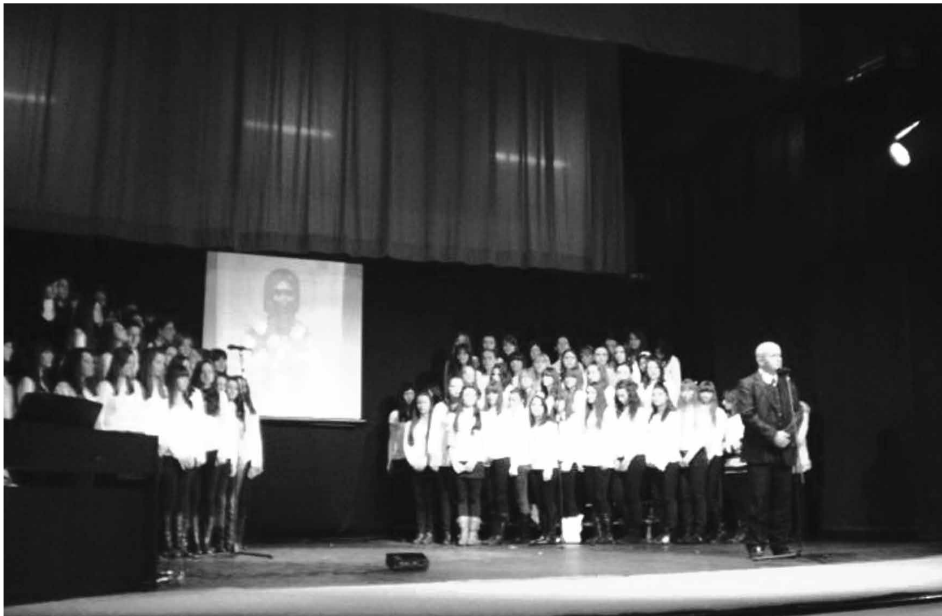
Са светосавске академије