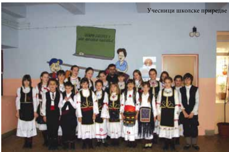
Учесници школске приредбе

Уз присуство радника школе свечаност су увеличали пензионери, који су дали велики допринос у образовању и васпитању бројних генерација ове школе, радници других школа, као и остали драги гости. Овом приликом размјењена су искуства о раду школа на нивоу наше општине. Ж.С.