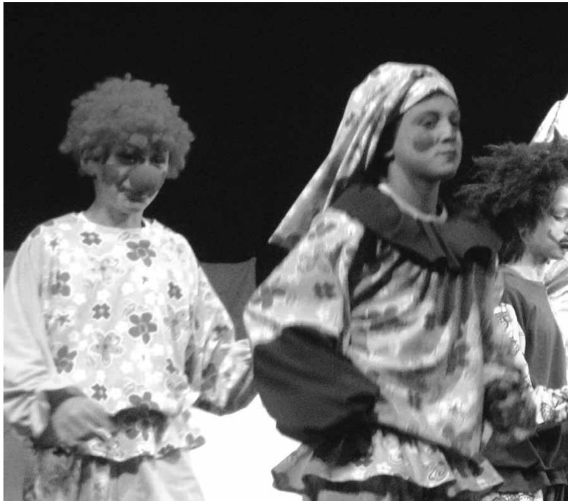
Детаљ са представе „Ма шта ми рече“.