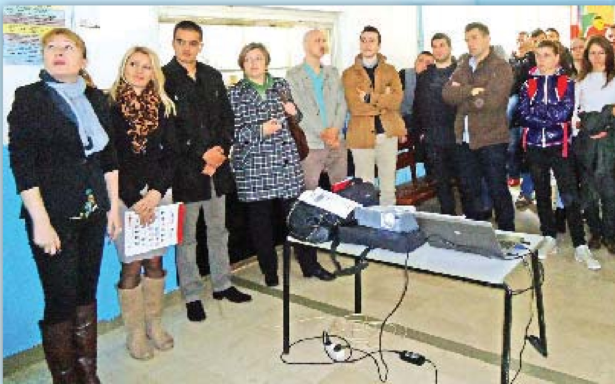
Prezentacija u Gimnaziji

Članovi/ice odbora uz podršku predstavnika Opštine promovisali su program i konkurs, te realizovali 3 prezentacija/radionica o programu i mobilizaciji lokalnih resursa u periodu dana 8. aprila (u: Gimnaziji, Mašinskoj školi i MZ Podbrdo) na kojima je učestvovalo ukupno 85 osoba, što je i doprinijelo da veći broj mladih može iskoristiti mogućnost podrške Omladinske banke.