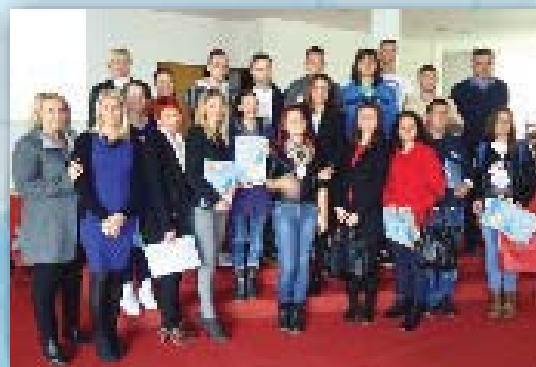
Ceremonija promocije rezultata projekata mladih

Zahvalnice i plakete za doprinos razvoju OB Mrkonjić Grad dodjeljene su načelnici Opštine, predstavnici Opštine za podršku programu OB, te najaktivnijim članovima i članicama Odbora OB Mrkonjić Grad. Ovo je bila prilika da se uruče uvjerenja svim članovima i članicama neformalnih grupa koji su uspješno realizovali projekte i uruče zahvalnice za predstavnike preduzeća, organizacija, institucija i građana koji su finansijski ili kroz materijal i usluge doprinijeli realizaciji projekata neformalnih grupa mladih. Bronzane plakete su dodijeljene svima koji su doprinijeli u iznosu od 100 KM do 500 KM, srebrne plakete svima koji su doprinijeli od 500 KM do 1.000 KM, a zlatne plakete za one koji su doprinijeli sa više od 1.000 KM.